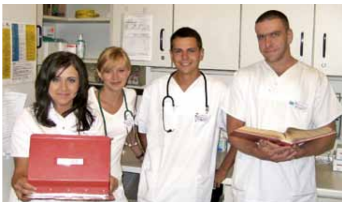
Wissbegierig: Austauschstudenten am Ev. Krankenhaus Holzminden

Wissen vermitteln und Jugendlichen eine Chance geben, die nicht aus Deutschland kommen. Das haben sich das Evangelische Krankenhaus in Holzminden und auch das Evangelische Bathildis-Krankenhaus in Bad Pyrmont zum Ziel gesetzt. Beide Häuser heißen Austauschstudenten herzlich willkommen. Das Bathildis-Krankenhaus pflegt gute Beziehungen zur