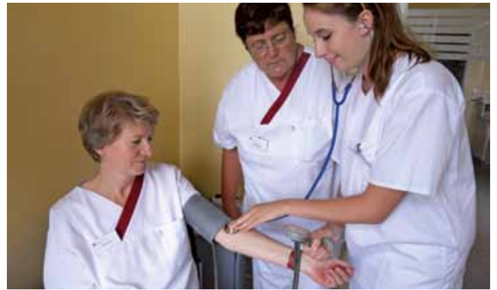
Engagiert: FSJlerin am Ev. Krankenhaus Neu-Bethlehem

Gesundheits- und Berufsfachschule des Universitätskrankenhauses Prag und das Evangelische Krankenhaus Holzminden nimmt regelmäßig Studenten der staatlichen medizinischen Universität Minsk auf. Die weissrussischen Studenten wissen das Angebot sehr zu schätzen und verstehen es als Chance, neben ihren medizinischen Kenntnissen auch ihre Sprachkenntnisse zu verbessern.