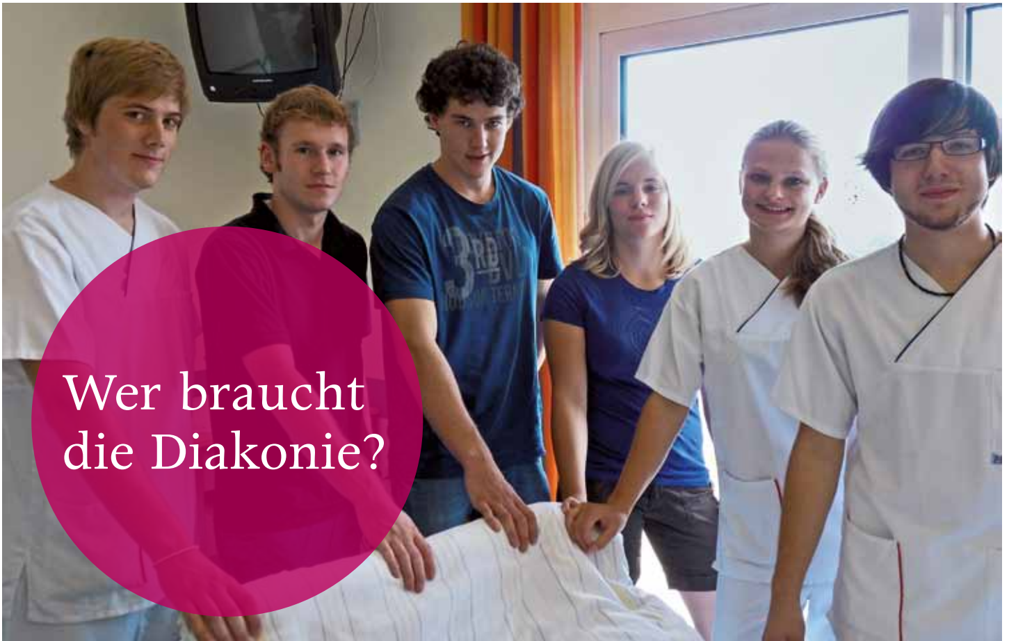
Hilfsbereit: Zivildienstleistende und Praktikanten am Ev. Vereinskrankenhaus Hann. Münden

Ob Kindergärten, Altenhilfe oder Jugendzentren. Viele Menschen wissen nicht, dass sie Angebote der Diakonie in Anspruch nehmen und was die Diakonie für die Gesellschaft leistet. Bei der Caritas verhält es sich im Übrigen nicht anders. Auf die Frage, was hält die Gesellschaft zusammen, gibt es viele Antworten. Eine davon ist sicherlich die Diakonie, die hilft, Mauern und Gräben zu überwinden.