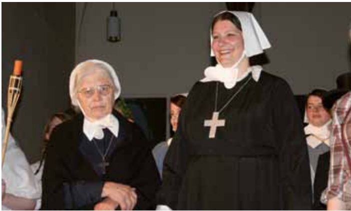
Beeindruckend: Das Musical „Unter der Haube“